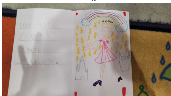
Illustration de l'action (photos, dessins, article de journal)

Les familles ont été reçues individuellement pour faire le point sur leur enfant, leurs réussites et leurs besoins. Cela nous permet d'ajuster notre travail et de créer du lien.